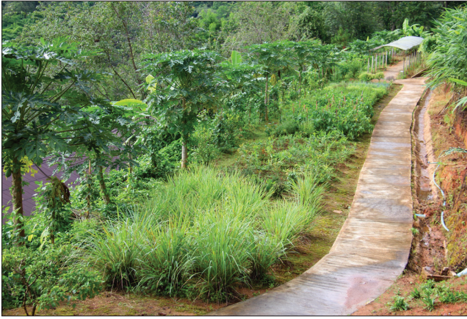
Los jardines y los árboles frutales pueden proporcionar productos orgánicos y saludables para la propia familia y otras personas en un pequeño terreno.

les. En total, estiman que las tormentas tropicales desde 1930 han contribuido a entre 3,6 y 5,2 millones de muertes en Estados Unidos, más que todas las muertes en todo el país por accidentes automovilísticos, enfermedades infecciosas o muertes en guerras durante el mismo período. Las estadísticas oficiales del gobierno sitúan el número total de víctimas de estas tormentas en unas 10.000 [cada una].