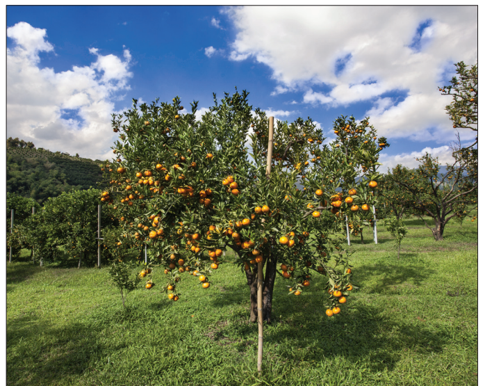
Sólo hay unos pocos lugares donde crecen árboles de cítricos, pero dondequiera que se viva se pueden cultivar árboles frutales de diferentes clases.

El interés anual que hay que pagar por la deuda nacional de 34 billones de dólares es más de lo que la nación gasta en el ejército. Y el gasto deficitario continúa sin disminuir. Mientras tanto, otras naciones se han dado cuenta y están trabajando para eliminar el dólar estadounidense como moneda de reserva. Algunos dicen que esto sucederá.