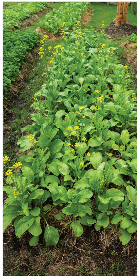
Ahora es el momento de adquirir experiencia en cultivar y conservar nuestros propios alimentos.

Cuando Dios nos da un lugar seguro para vivir, no debemos considerarlo permanente. Todo lo que hay en esta tierra es sólo un medio temporal para que Él cumpla Su propósito eterno; ahora mismo, eso significa Sus actos finales. Cada uno de nosotros se está preparando a su manera para salir de este lugar y debe centrarse en lo que es eterno-el reino de Dios. Sólo él es permanente. A través de Su Espíritu, Él vive dentro de nosotros y suplirá todas nuestras necesidades para la honra de Su nombre.