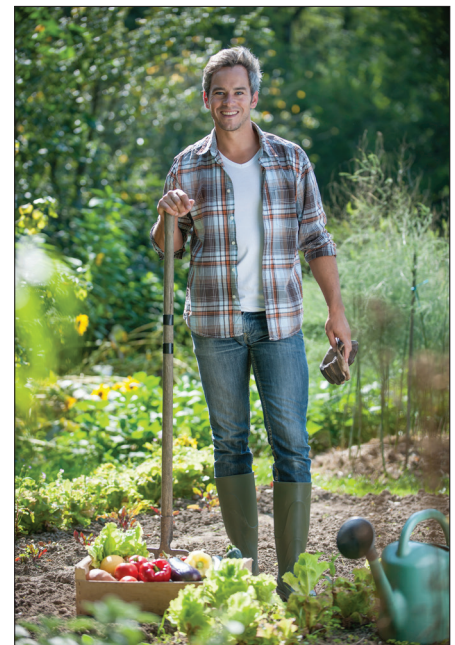
Dios bendecirá a aquellos que estén dispuestos a aprender a cultivar un huerto con éxito.