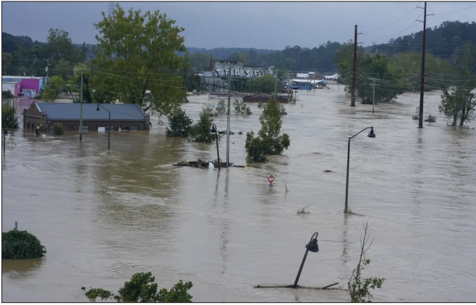
El huracán Helene siguió a una tormenta en Asheville, Carolina del Norte. Ríos inundados comunidades en todo el estado, dejando prácticamente nada más que barro y escombros.

condensa, lo que arroja más precipitaciones.