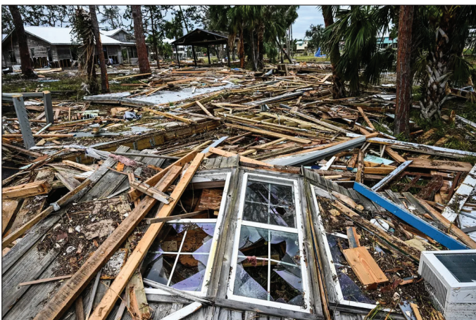
Una marejada ciclónica de 15 a 20 pies azotó Horseshoe Beach, Florida. La comunidad es relativamente pobre. Muchas personas viven en casas móviles. El huracán Idalia azotó la misma localidad en 2023.

“Normalmente, las tormentas que se mueven rápidamente suponen menos peligro de lluvia, pero Helene fue una gran excepción. En el sur de las montañas Blue Ridge, la lluvia de Helene se vio reforzada por el terreno y lo que se conoce como ‘levantamiento orográfico’. Cuando una tormenta se ve obligada a ascender por la ladera de una montaña, el aire se enfría y se