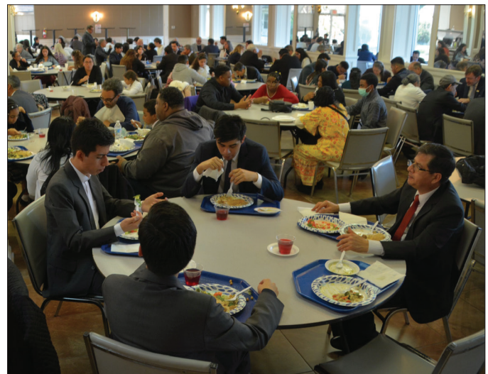
Hubo excelente comida vegana y compañerismo a la hora de comer