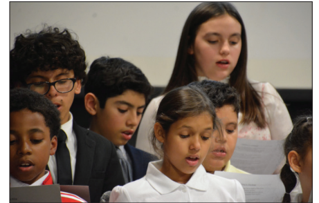
El coro juvenil presentó hermosos especiales

En el Taller 2 el Hermano Elvis Feliciano habló sobre las palabras de Jesús, Tengo sed (Juan 19:28). ¿Qué es tener sed? Es un mecanismo de defensa que nuestro cerebro utiliza para que estemos atentos a la homeostasis de nuestro cuerpo. El enfoque de esta declaración no está arriba con el Padre o abajo entre la multitud, sino en él mismo Jesús.