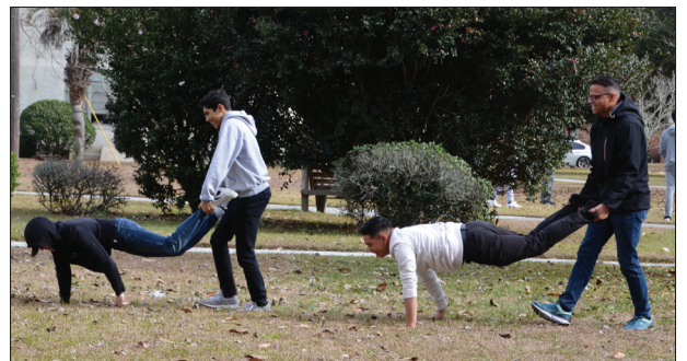
Este difícil ejercicio fue parte de las actividades juveniles

“¡He aquí el antropos!” –el ser humano, representante del hombre ante todo el universo. El Salvador resucitado y ascendido es el Representante de todos.